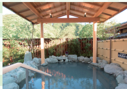
京王高尾山温泉/極楽湯

高尾山下山後にゆつくり疲れと汗を流しに立ち寄りたい。露天炭酸石張り風呂や微細な泡が体を包む檜風呂などの7種のお風呂があります。