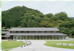
高尾599ミュージアム

高尾の四季の自然を映し出すプロジェクションマッピングが大人気。各コニスの見どころや植物などの説明もあります。