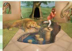
高尾山トリックアート美術館

アートとアミューズメントが融合した、だまし絵の美術館。子供も大人も楽しめます。撮影すると一段とおもしろいので、カメラを忘れずに。