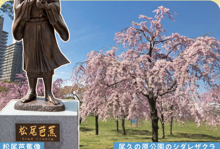
松尾芭蕉像 尾久の原公園のシダレザクラ

荒川区 産業経済部 観光振興課 TEL 03-3802-4689 荒川区観光情報トップページ http://www.city.arakawa.tokyo.jp/kanko/