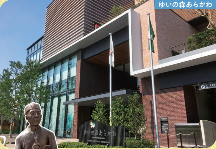
ゆいの森あらかわ