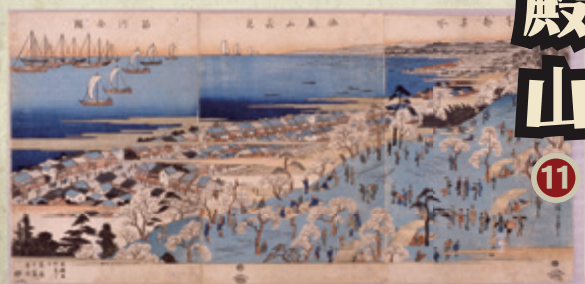
東都名所 御殿山花見 品川全国

北品川の高台、御殿山には江戸初期、幕府の建てた御殿があり、将軍の茶会や鷹狩だけでなく幕府の重要行事(馬揃)・会議にも使用された。寛文年間に吉野桜が植えられて以来、桜の名所となり多くの浮世絵にも描かれた景勝地だった。一方、長州藩攘夷派による英国公使館焼討ち事件という幕末史の舞台としても知られる。【品川区北品川3~4丁目】