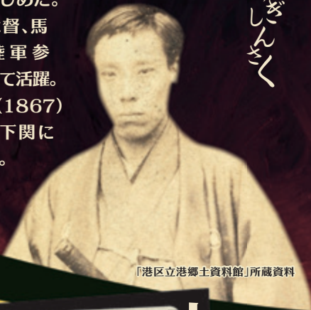
「港区立港郷土資料館」所蔵資料

長州藩士。号は東行(とうぎょう)など。尊王攘夷運動における倒幕派の中心人物。松下村塾の門下。長州藩内に奇兵隊を結成で知られる。上海に滞し、日本の危機を実感。文久2(1862)年、久坂玄瑞・伊藤博文(俊輔)らと品川御殿山に建設中のイギリス公使館を焼討ち。脱藩の罪で入牢、許されて下関戦争の講和使節となる。伊藤らと馬関(下関)に拳兵したことで、藩内の倒幕派が主導権を握り、幕府の第二次長征軍と対決せしめた。海軍総督、馬関海陸軍参謀として活躍。慶応3(1867)年4月下関にて病没。