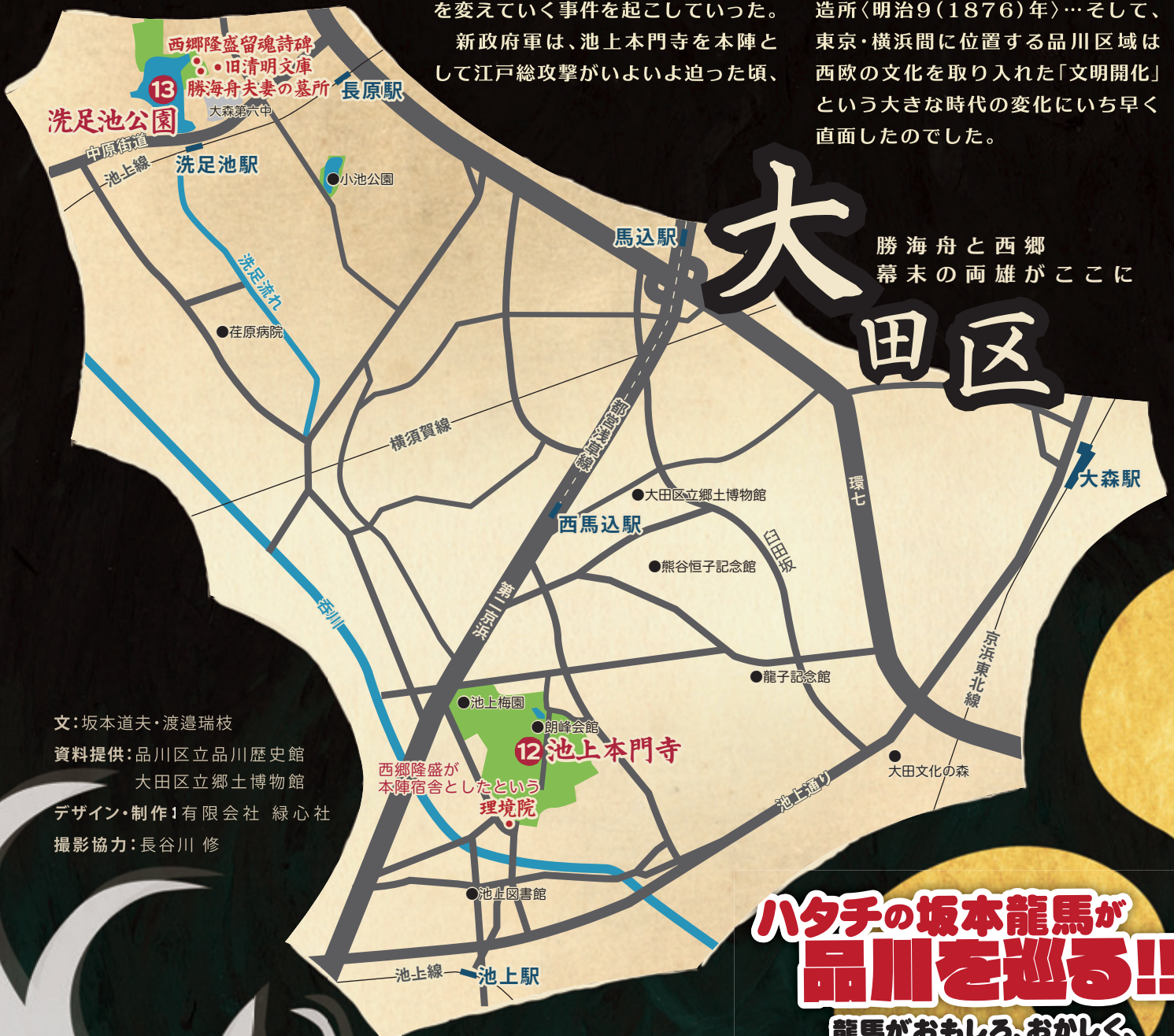
勝海舟と西郷 幕末の両雄がここに

大政奉還後、彰義隊の事変で江戸の変転は終末を迎え、江戸は東京と改められた。明治新政府は日本を近代的な国家にするために「富国強兵」をめざし、殖産興業、学制の公布、兵制、税制など、改革のための施策に次々と取り組んだ。品川灯台〈明治3(1870)年〉点灯・鉄道敷設〈明治5(1872)年〉開通・官営品川硝子製造所〈明治9(1876)年〉…そして、東京・横浜間に位置する品川区域は西欧の文化を取り入れた「文明開化」という大きな時代の変化にいち早く直面したのでした。