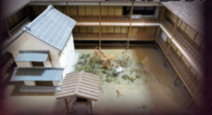
品川歴史館にミニチュア模型を展示。